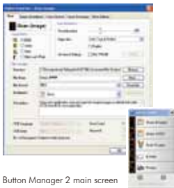
The Button Manager 2 main screen

Button Manager V2 facilita la scansione e l'invio delle immagini alle vostre destinazioni preferite con la sola pressione di un tasto. Con esso è possibile scansionare e caricare automaticamente i documenti su cloud repositories come Google Docs, Microsoft SharePoint o FTP. In aggiunta è possibile trasferire le immagini scansionate o il testo riconosciuto da OCR (Optical Character Recognition) nelle vostre applicazioni di text editor come, ad es., Microsoft Word.