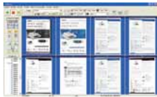
The AvScan main screen

Document Imaging è il primo passo verso il Document Management. Tuttavia immagini di poca qualità possono in seguito creare problemi ai processi d'indicizzazione e memorizzazione, aumentando i costi di post-scansione. AVScan X garantisce che tutti i documenti siano controllati e puliti al momento della scansione così da essere perfetti per le elaborazioni successive. AVScan X è una soluzione intelligente di scansione e creazione immagini. AVScan X possiede diverse funzionalità che convertono e indicizzano le immagini scansionate in documenti elettronici per una ricerca semplice e veloce.