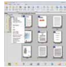
The PaperPort SE14 main screen

La scelta professionale per organizzare e condividere i vostri documenti