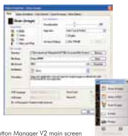
The Button Manager V2 main screen

Button Manager V2 facilita la scansione e l'invio delle immagini alle vostre destinazioni preferite con la sola pressione di un tasto. Con esso è possibile scansionare e caricare automaticamente i documenti su cloud repositories come Google Docs, Microsoft SharePoint, o FTP. In aggiunta è possibile trasferire le immagini scansionate o il testo riconosciuto da OCR (Optical Character Recognition) nelle vostre applicazioni di text editor come, ad es., Microsoft Word.